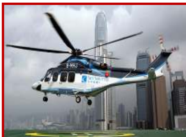
Elicottero Sky Shuttle Hong Kong

N.B. Le immagini utilizzate nel presente programma di viaggio sono puramente indicative e non costituiscono obbligazione alcuna