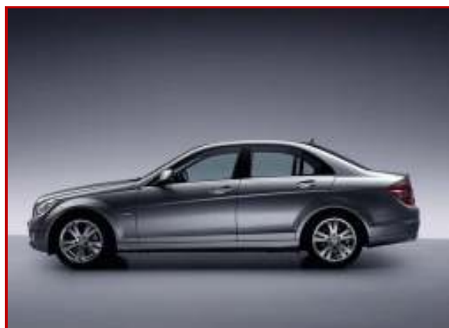
Limousine con autista