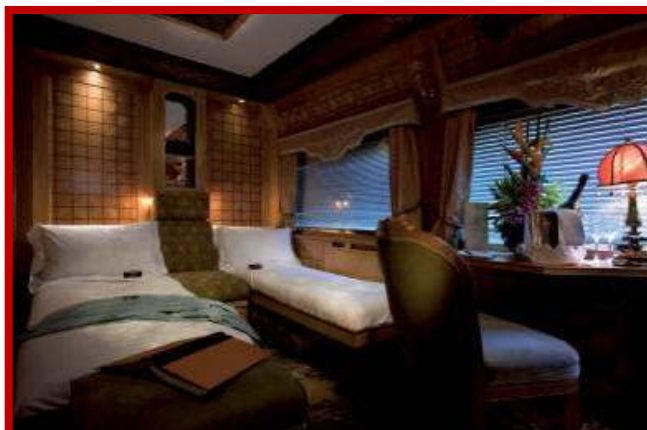
Presidential Cabin Eastern & Oirruenta Express Train