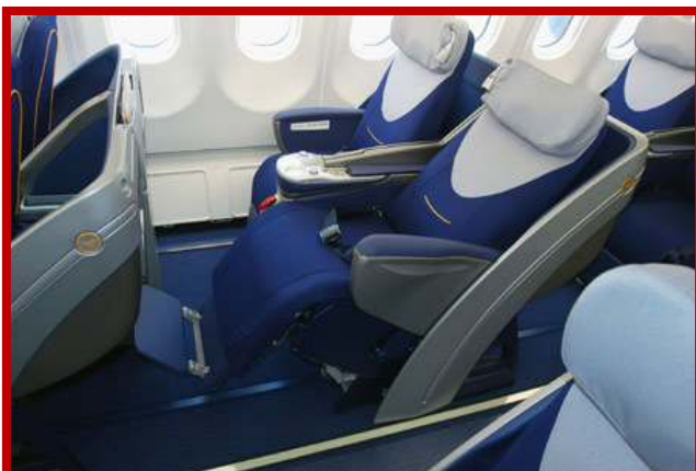
Volo aereo intercontinentale in Business Class.